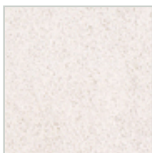
Valkoinen (NCS S 0500-N)